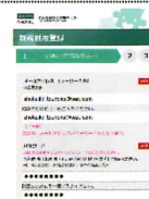
<スマートフォンの場合>